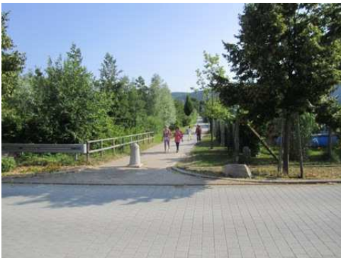
Der Fußweg von der Dölchenstraße zur Schulstraße führt sicher zur Schule.