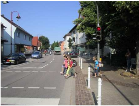
Sicher über die Straße an der Fußgängerampel.