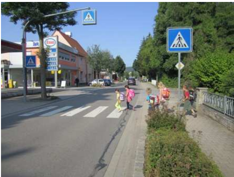
Dieser Zebrastrreifen soll genutzt werden.